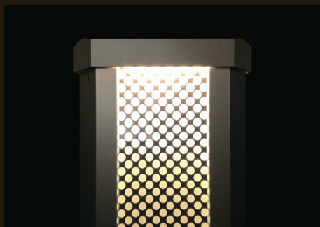
太陽光発電を感じさせない洗練されたガラス面と美しいグラデーション照明。